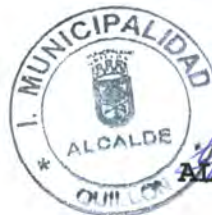
ALBERTO GYHRA SOTO ALCALDE

AGS/JPP/UZG/CSS/LKJ/jha Distribución: -Interesado -Subdepto. Finanzas -Subdepto. Personal -Archivo Municipal