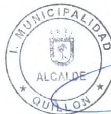
VLADIMIR PEÑA MAHUIER ALCALDE (S)