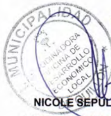
NICOLE SEPÚLVEDA VALDEBENITO COORDINADOR PROGRAMA PRODESAL