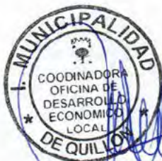
NICOLE SEPULVEDA VALDEBENITO COORDINADORA ODEL