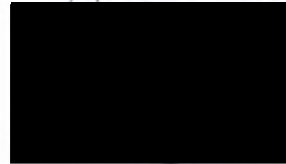
STEFANIA MANRIQUEZ LAGOS MONITORA PROGRAMA 4 A 7