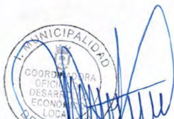
NICOLE SEPULVEDA VALDEBENITO COORDINADORA ODEL