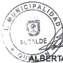
ALBERTO GYHRA SOTO ALCALDE I. MUNICIPALIDAD DE QUILLON