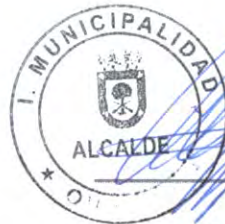
EMPLEADOR C.I. N° [REDACTED]