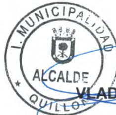
VLADIMIR PEÑA MAHUZIER ALCALDE (S)