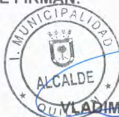
VLADIMIR PENA MAHUZIER ALCALDE (s)