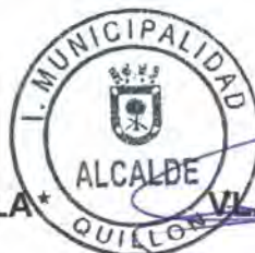
VLADIMIR PEÑA MAHUIER ALCALDE (S)