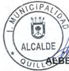
ALBERTO GYHRA SOTO ALCALDE