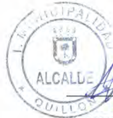
EMPLEADOR ALBERTO GYHRA SOTO C.I. [REDACTED]