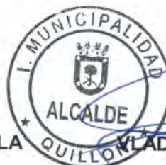
VLADIMIR PENA MAHUIER ALCALDE (S)