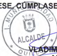
VLADIMIR PEÑA MAUZIER ALCALDE (S)