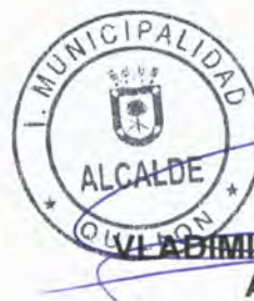
VLADIMIR PEÑA MAHUZIER ALCALDE (S)