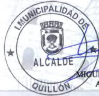
MIGUEL PEÑA JARA ALCALDE