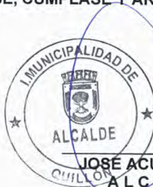
JOSÉ ACUÑA SALAZAR ALCALDE (S)