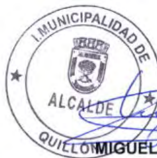
MIGUEL PEÑA JARA ALCALDE

MGJ/jfm DISTRIBUCIÓN -SECRETARÍA MUNICIPAL -ABASTECIMIENTO