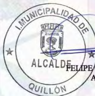
FELIPE CATALAN VENEGAS ALCALDE