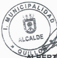
ALBERTO GYHRA SOTO ALCALDE I. MUNICIPALIDAD DE QUILLON