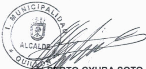
ALBERTO GYHRA SOTO ALCALDE I. MUNICIPALIDAD DE QUILLON