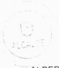
ALBERTO GYHRA SOTO ALCALDE I. MUNICIPALIDAD DE QUILLON